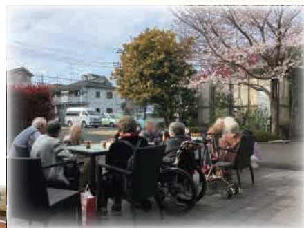
コーヒーレクリエーション