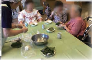
手作りおやつレクリエーション